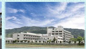
長浜市立湖北病院