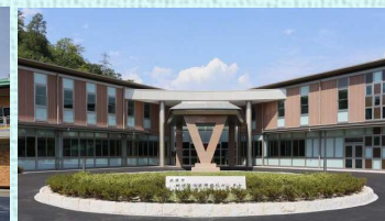
近江診療所 (ふくしあ)