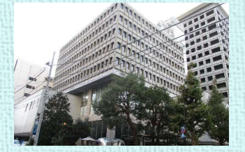
地域医療振興協会