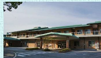
地域包括ケアセンターいぶき