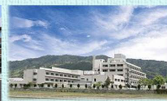
長浜市立湖北病院