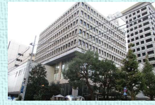
地域医療振興協会