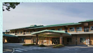
地域包括ケアセンターいぶき