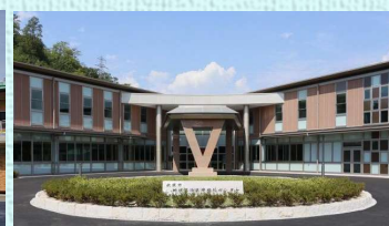
近江診療所（ふくしあ）