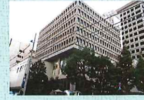
地域医療振興協会