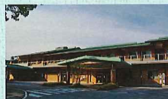
地域包括ケアセンターいぶき