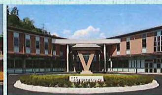
近江診療所（ふくしあ）