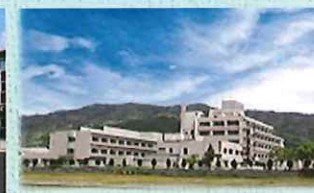
長浜市立湖北病院